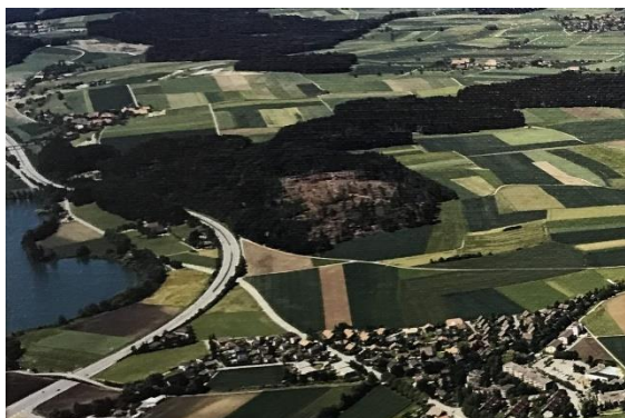
Bubenloo nach Sturm Lothar 2020

Der Sturm Lothar zerstörte am 26.12.1999 rund 11 von 17 Hektaren Mischwald der BGU. Dieser Sturm führte zu einem finanziellen Verlust von gegen Fr. 100'000.-. In den Folgejahren des Sturms rüstete die BGU ca. 4350 m 3 Holz auf, was der Holzmenge von ca. 30 Jahresholzungen entspricht. Ein Teil der Fläche wurde als Versuchsfläche dem Amt für Wald und Landschaft zur Verfügung gestellt und mit speziellen Baumgruppen neu bepflanzt, oder sich selbst überlassen. Dies, um herauszufinden, unter welchen Voraussetzungen sich der Wald nach einem derart heftigen Sturm mit und ohne menschliche Eingriffe am besten erholt.