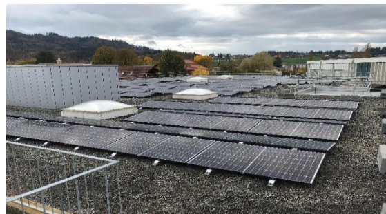
Photovoltaik Anlage auf Gewerbeliegenschaft

Seit 2015 besitzt die BGU ein Leitbild und ein spezielles Reglement über Förderbeiträge, zudem wurde das Organisations- und Nutzungsreglement den neusten Gegebenheiten angepasst.