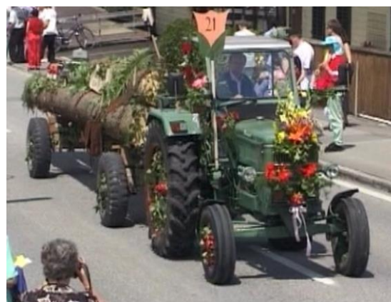
Tannenfeuer anlässlich 750J Urtenen 27.06.1999

Der Artikel 119 der Bernischen Kantonsverfassung verpflichtet die Bürgergemeinden, sich «nach Massgabe ihrer Mittel zum Wohl der Allgemeinheit einzusetzen».