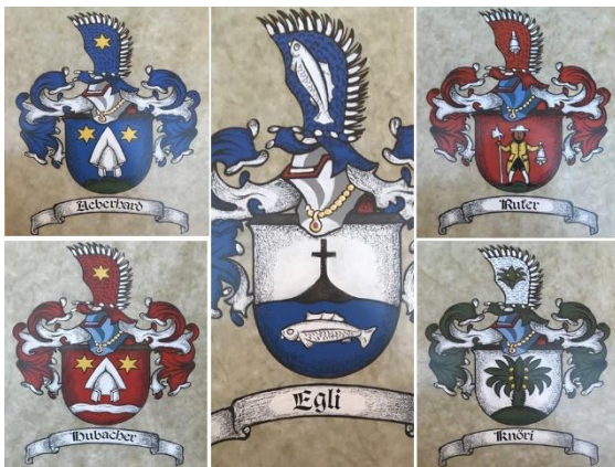
Ursprüngliche Bürgergeschlechter BG Urtenen

In den Jahren 1839/40 erliess der Kanton Bern ein Gesetz, nach dem Schupposenbesitzer den sogenannten «unberechtigten» Bürgern, welche Weiderechte und Holznutzungen besaßen, Land und Wald als Eigentum abtreten mussten. Damit sollte armen Tagelöhnern Land zum Weiden und Bepflanzen, sowie Holz zum Kochen und Heizen überschrieben werden.