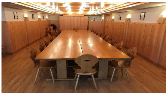
Bürgerstube im Zentrum finanziert durch die BGU

Seitdem nicht mehr die Eigenversorgung der Bürger im Vordergrund steht, hat sich die BGU, mit steigenden finanziellen Möglichkeiten, zunehmend für das Allgemeinwohl eingesetzt. Beispielsweise durch: günstige Baurechtszinsen für das einheimische Gewerbe und das «Begleitete Wohnen», das Bereitstellen von günstigem Wohnraum, die Schenkung des Baulands für den Alterswohnsitz, Spende einer Glocke in der Kirche, die Finanzierung der Bürgerstube im Gemeindehaus, aber auch mit vielen Beiträgen für verschiedenste gemeinnützige und kulturelle Zwecke.